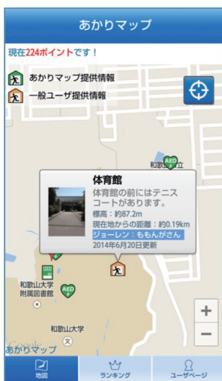
図1 オフライン時にも利用可能な災害時支援システム

私たちの研究グループの研究は、多様な環境における様々なコミュニケーション支援システムを構築することです。これまでも、多数のグループと組んで、様々なコミュニケーション支援システムを構築してきました。図1は、ネットワークがないときでも、直前までの最新情報を利用可能な災害時支援システムです。図2は、病院内の外国人との対話を支援するシステムで、正確な翻訳を利用可能です。図3は、高齢者にも使い易い栄養指導支援システムで、多様な料理の入力が可能な仕組みを備えています。私たちは、現場で発生する様々な問題を、情報技術を使って解決することを目指しています。