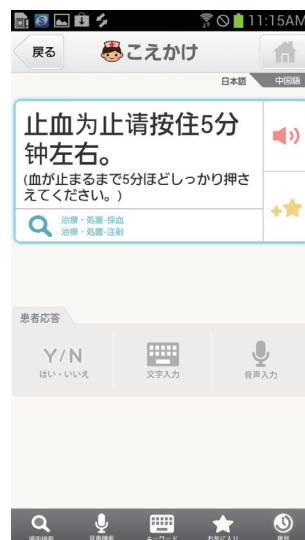
図2 多言語医療対話支援システム