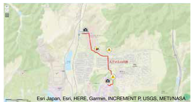
図2 Aグループが作成した経路図

図中の吹き出しは写真の撮影地点であり、吹き出し部分をクリックすると図3のように写真が表示される。