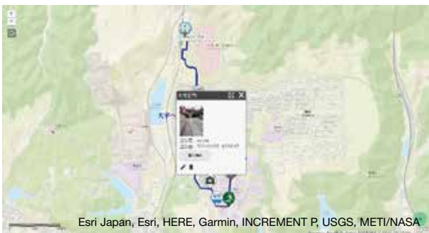
図3 Bグループが作成した経路図 (途中で撮影した写真を表示)

ものがいくつか用意されており、適切なものを選択できるようになっている。図5はBグループの撮影した写真を表示させたものである。