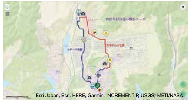
図6 AグループとBグループが作成した経路図を統合したマスタマップ（デジタル防災マップの完成形）

今回は、“あがらマップ”のシステム動作確認を目的にしていたため、防災マップの作成ではなく、大学から和歌山大学前までを散歩するコースの作成を行った。その結果、現在のシステムで、“あがらマッ