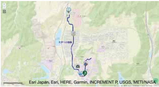
図4 Bグループが作成した経路図

ものがいくつか用意されており、適切なものを選択できるようになっている。図5はBグループの撮影した写真を表示させたものである。