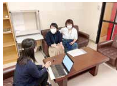
現職院生の実習（2年目）