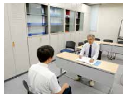
面接対策も行っています

担当指導教員による週1回のマンツーマンでの面談に加え、月2回の定期テストの実施や直前の面接対策等、採用試験に備える取り組みを実施しています。また、各院生の授業力の課題を見出すための「課題分析」の授業内で行う模擬授業は、採用試験の対策にもなっています。