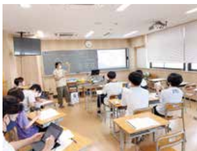
模擬授業を実施している様子