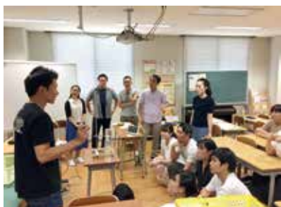
共通科目の授業の様子

▶教職大学院では、授業を短時間で集中的に受講することによる教育効果の向上を目指し、1科目の講義を週に2コマ実施する4学期制（クォーター制）を採用しています。学生にとって、一週間で学ぶべき学習領域が半減することにより、集中的に学ぶことによる教育効果が得られます。