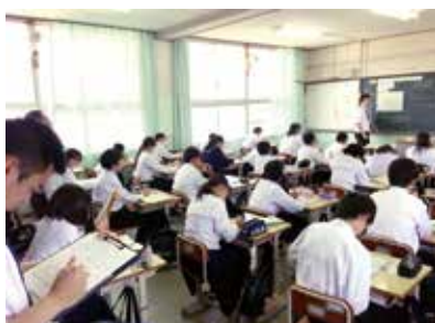
学部卒院生の実習