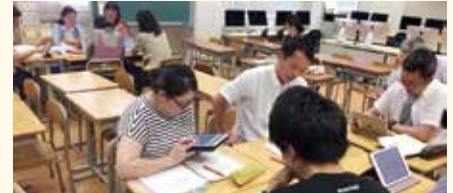
タブレット端末の活用

ほとんどの授業が研究者と実務家教員等によるTTで行われ、アクティブ・ラーニングやICTの積極的活用などを実際に経験しながら、Society5.0に向けた学習環境づくりについて考えを深めるとともに、それらを準備する実践的態度を養います。