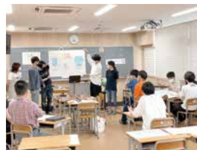
模擬授業後の協議