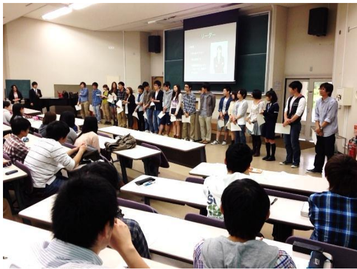
リーダーの立候補