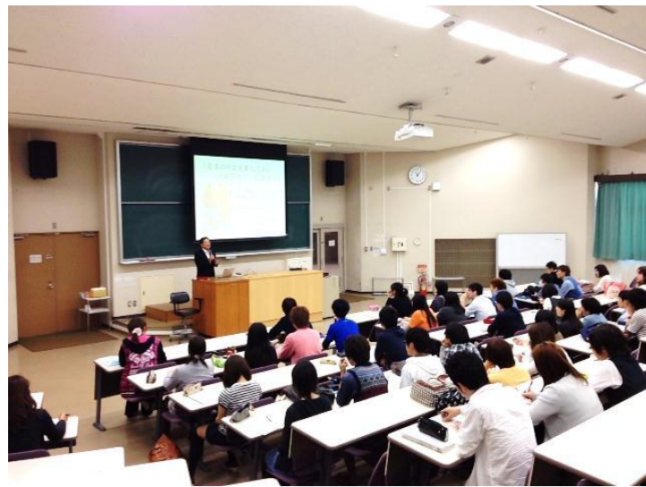
連携企業によるテーマ発表