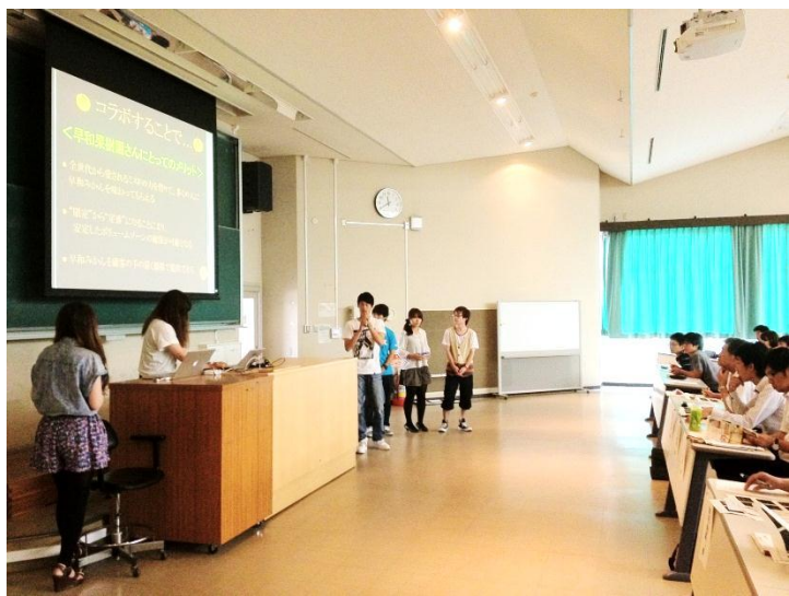
最終プレゼンテーション