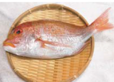
和歌山県産キダイ。旬は春から秋だが年中おいしくいただける

【材料】 ▽キダイ(連子鯛)：1匹(約30センチ)▽酒：1カップ▽昆布：15センチくらい▽長ネギ(白い部分)：適量▽塩：少々 【作り方】 ①うろこを引き内臓を取り除ききれいに洗う(店で処理してもらってもよい)。水気を拭き取る。 ②塩を薄く振る。 ③飾り包丁(切り込み)を3カ所ほど入れる。 ④長ネギの白い部分をむき取り、繊維に沿って千切りにし白髪ネギを作り10分ほど水にさらす。 ⑤フライパンにだし昆布を敷きキダイをのせ、酒を入れふたをして火を付ける。 ⑥最初は強火で、沸騰したら、弱めの中火で10分程度蒸す。 ⑦身が崩れないようにフライ返しなどで皿に盛り、先に水にさらしておいた白髪ネギを飾る。 *好みの野菜やキノコと一緒に酒蒸しする。うまみがたっぷり染み込み、具材の味も相まつちよと豪華なおかずになる。