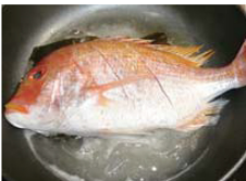
ふたをしてシンプルに酒と昆布で蒸す