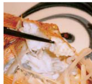
ふんわり蒸し上がった白身は上品なおいしさ