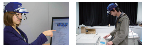
写真 左：Web の評価 右：製品の評価