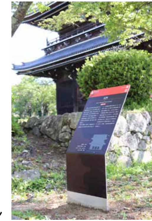
岩出市観光サインデザイン