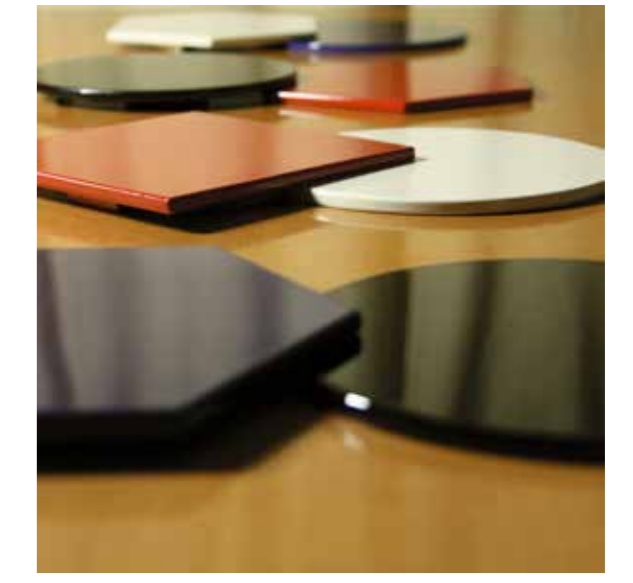
紀州漆器との共同研究 「iro-ita」