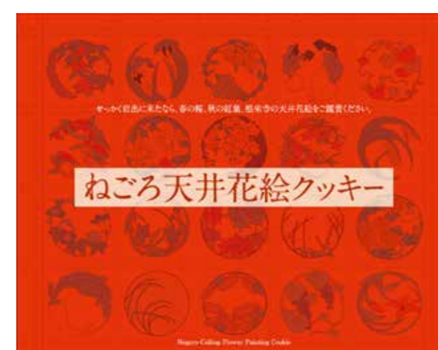
「ねごろ天井花絵クッキー」 企画・デザイン