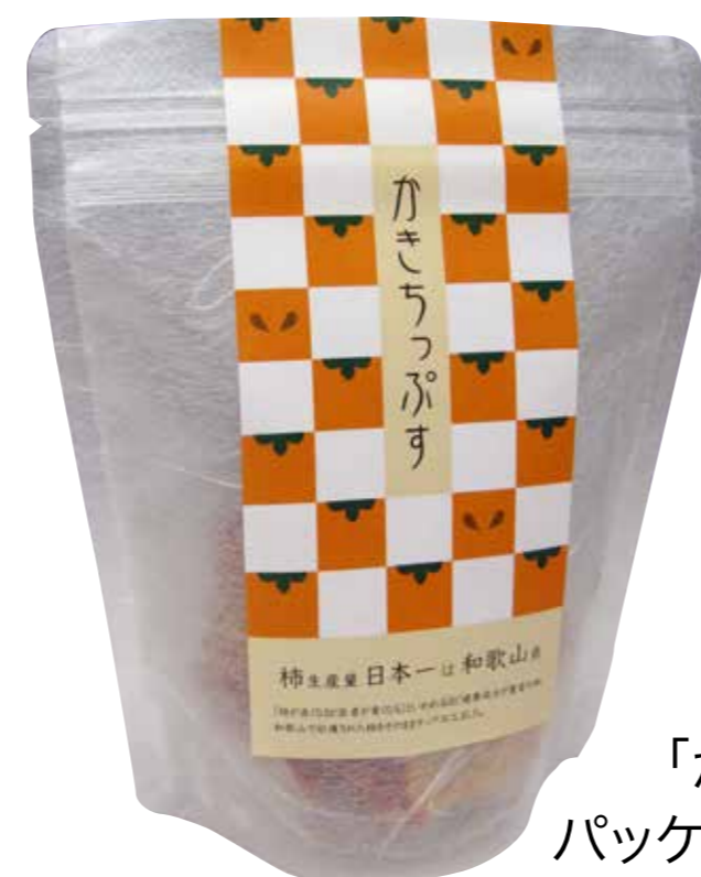
「かきちっぷす」 パッケージデザイン