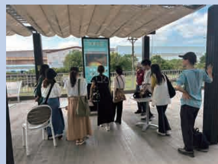
官営八幡製鐵所旧本事務所眺望スペース (2023 年 9 月 27 日)

午後には、青木が合流して博多駅から小倉駅まで特急ソニックで移動し、官営八幡製鐵所旧本事務所眺望スペースを訪れました。ここでは、ユネスコの世界文化遺産 (2015 年登録) に含まれる「旧本事務所」(1899 年竣工) の建物を眺め、モニターのビデオでその内装について学び