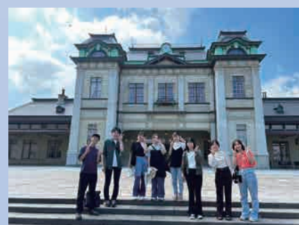
門司港駅舎の前 (2023 年 9 月 28 日)