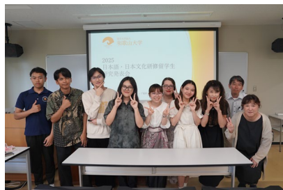
＜日本語・日本文化研修留学生研究発表会＞

留学生のための進路指導、就職支援を行っています。また、和歌山大学国際同窓ネットワークにて、日本語・日本文化研修留学生には、帰国後も修了者同士が連絡を取り合えるように国際イニシアティブ基幹日本学教育研究センターがお手伝いします。