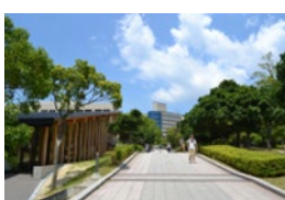
＜キャンパスの様子＞

和歌山大学では大学に隣接している民間寮（グリーンプラネットハウス）を宿舎として紹介しています。