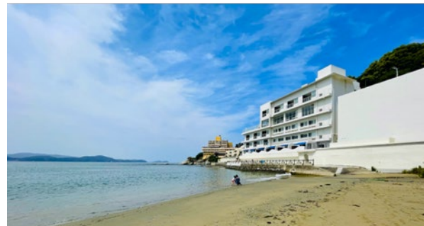
<和歌山市・あじろ浜>