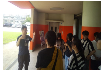
<日本学演習：小学校跡地 フィールドワーク>

日本語の特徴を学び、外国人に対する日本語の教え方や、「やさしい日本語」「継承語」など多言語社会における日本語、日本語教育の問題について学ぶ。