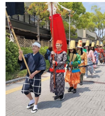
<日本事情：和歌祭・唐人行列>