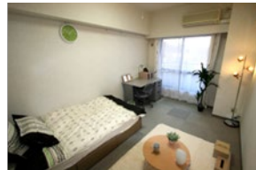
＜グリーンプラネットハウス＞