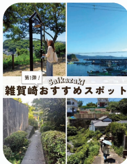
雑賀崎おすすめスポット