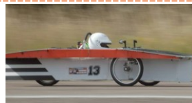
図4 白浜大会走行時のMSC500