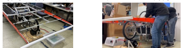
図4実際に動かしている様子