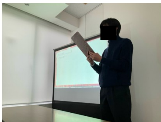
写真：話し方勉強会の様子