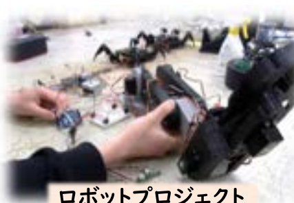
ロボットプロジェクト