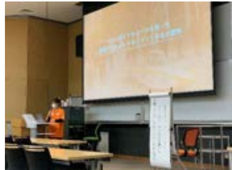
ミッション成果発表会の様子

※本制度は、2013年度までの「自主演習プロジェクト」から制度変更したものです。