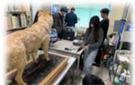
和歌山大学 ニホンオオカミプロジェクト