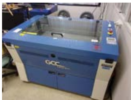
レーザーカッター