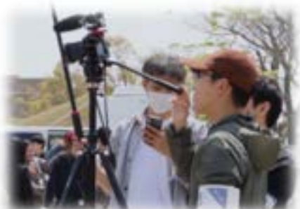
新クリエ映像制作プロジェクト！ -Filmage-