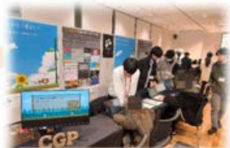
和歌山大学 クリエゲーム制作プロジェクト (CGP)