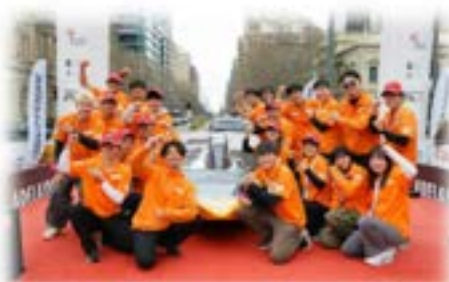
和歌山大学ソーラーカープロジェクト