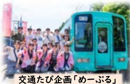
交通たび企画「めーぷる」