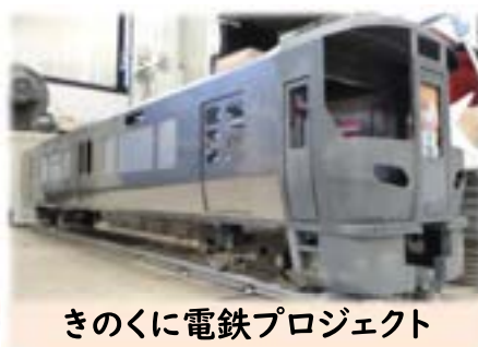
きのくに電鉄プロジェクト