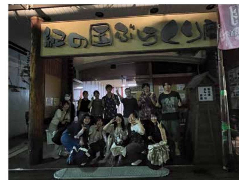
紀の国ぶらくり劇場での大衆演劇の観劇。2025年7月