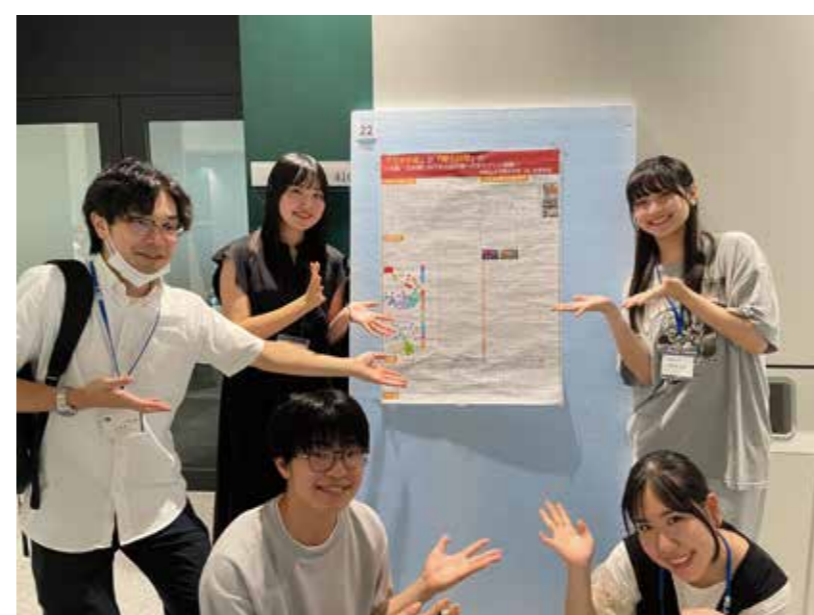
観光学術学会での学部学生ポスター発表。2024年7月

観光・文化・社会について、社会学的な理解を深め、表現できるようになることを目指します。ゼミは課題図書や論文の輪読や読書感想文の紹介を行いつつ、フィールドワーク、学会ポスター発表、その他イベントごとなどを行います。ゼミや関連する講義で学んだことの実践、ゼミ生の間での対話、自身の価値観や行動原理の問い直しを重視しています。