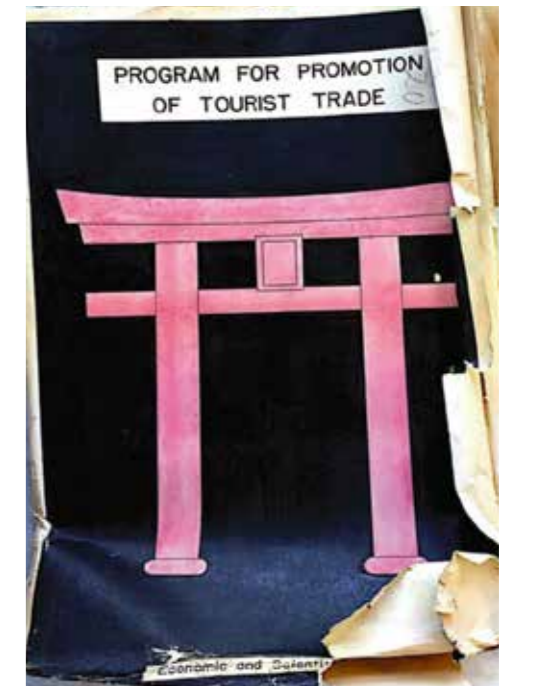
GHQ経済科学局による日本の観光振興に関するレポート。1950年。著者所蔵資料。

この時期は戦争末期の休止期間を経て観光政策・行政・事業が再開されはじめた時期であり、国際観光事業や観光まちづくりがデモンストレーションされ、その意義が主張された時代でした。また多くの連合軍関係者や国際観光客が、ときに米軍や旅行会社のツアーを利用しながら、日本を旅した時代でもありました。こうした例を調査しながら、観光と占領・復興・冷戦の関係性について、また観光の社会的な役割について探っています。