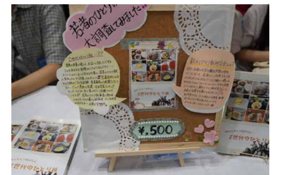
ゼミの課外活動(サブゼミ)として同人誌を制作し、インテックス大阪で開催された文学フリマでの販売を行った。2026年4月~9月