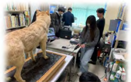
和歌山大学 ニホンオオカミプロジェクト