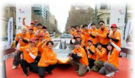
和歌山大学ソーラーカープロジェクト