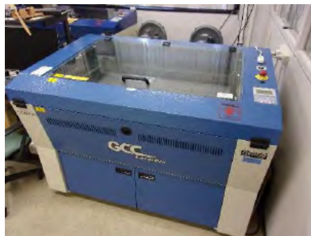
レーザーカッター