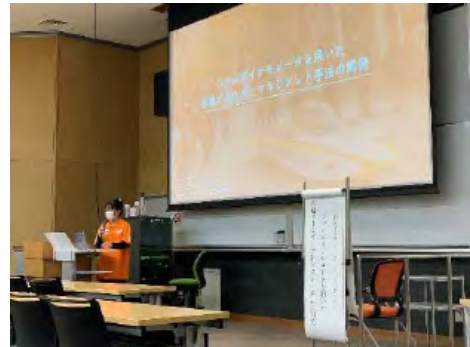
ミッション成果発表会の様子

※本制度は、2013年度までの「自主演習プロジェクト」から制度変更したものです。