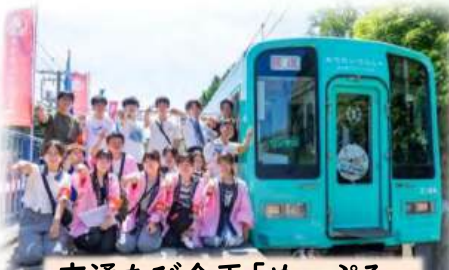
交通たび企画「めーぷる」