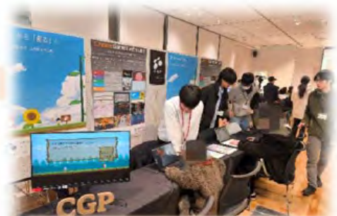
和歌山大学 クリエゲーム制作プロジェクト (CGP)