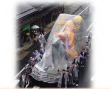
高野山観光推進プロジェクト 「ばあむ。」