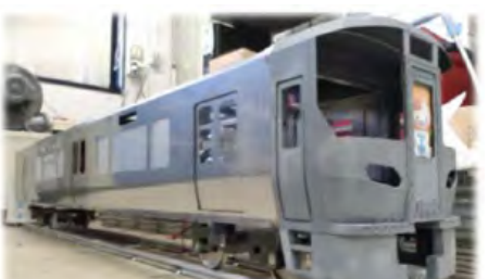
きのくに電鉄プロジェクト