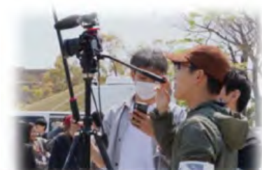
新クリエ映像制作プロジェクト！ -Filmage-