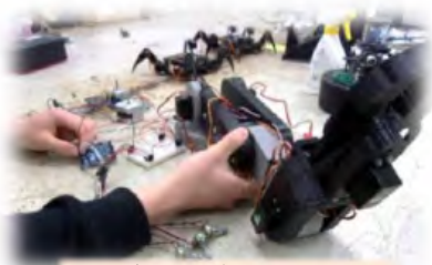
ロボットプロジェクト