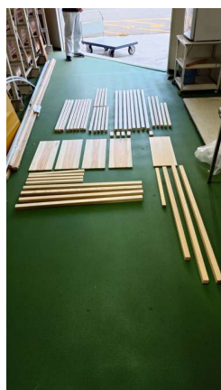
図7 加工前の紀州材

素材には「紀州材（杉・檜）」を採用し、湯浅町の業者に直接発注をした。木材の種類については、杉と檜の特性を考慮し、展示物の重量や耐久性に見合った選定を行った。