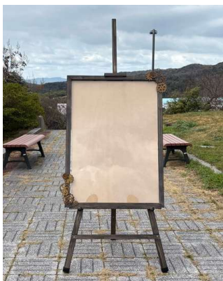
図8 「歴史」をテーマとしたイーゼル