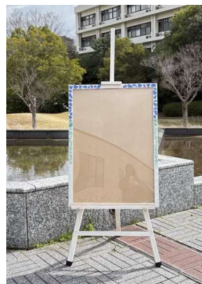
図9 「海」をテーマとしたイーゼル