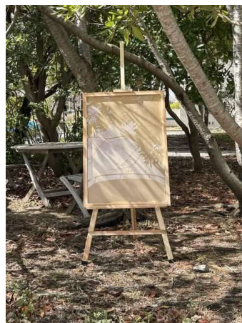
図11 「紀州材の美」をテーマとしたイーゼル

メンバーの多くが観光学部の文系学生であったため、ものづくりの設計段階における意思疎通に苦戦した。何を優先して設計すべきかという共通認識を持つことの難しさを学びながら、地元の職人・業者と協働するプロセスを経験した。