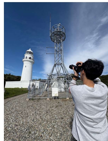
図1, 2, 3 潮岬灯台での写真展の様子