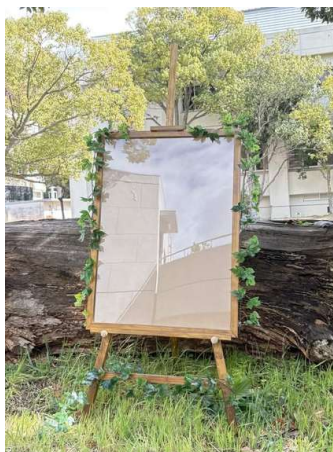
図10 「自然」をテーマとしたイーゼル