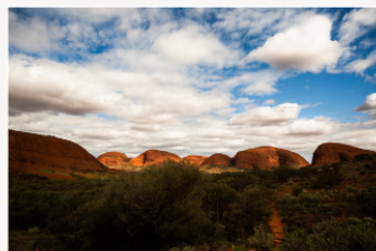
左) ウルル 中央) カタジュタの大地 右) カタジュタの巨岩群

何にでもテーマを決めた方がいい。迷わないから。 今回の旅のテーマは「大地を感じる」 次に決めたものは捨てること。今回はおいしい食事とお土産。 歩きやすく、動きやすい準備をして、 “地球のへそ”ウルルとNZの南島に行くことに決めた。