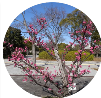
梅の花も咲いてたニャン