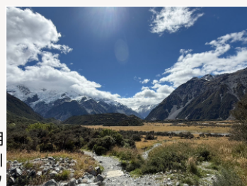
上) テカポ湖 中央) テカポ湖からの天の川 下) マウント・クック