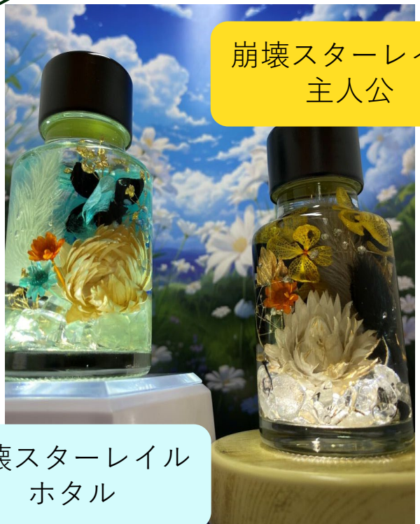
崩壊スターレイル 主人公