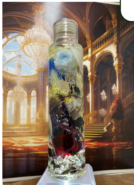
Fate/Grand Order ジャンヌ・ダルク