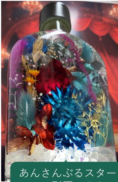
あんさんぶるスターズ!! 影平 みか

秋号で語ったハーバリウムのお店が閉店するらしく 慌てて可能な限りすべての休みを使って行ってきました 休みが足りなくて、一日に9個作ったりしました まったく推しが多いオタクは大変だぜ