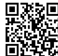
会場へのアクセス