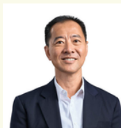
タスマニア大学 キャン・セン・オーイ